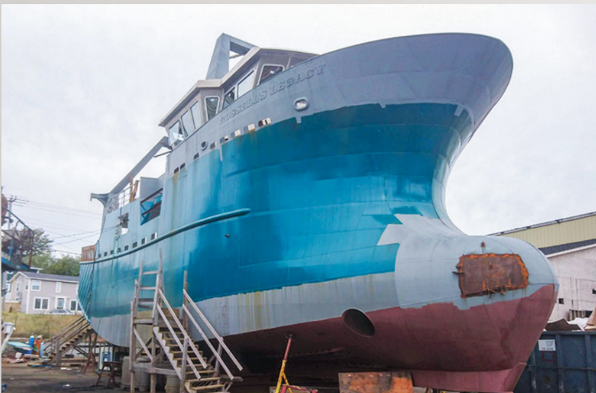
Chantier Maritime, Matane, Canada