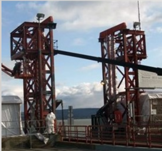
Débarcadère Îles-aux-Grues, Canada