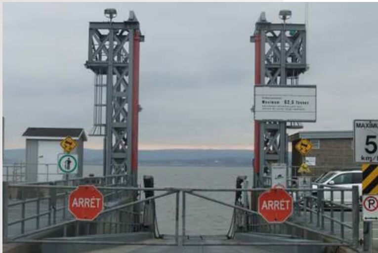
Port ferroviaire, Baie-Comeau, Canada